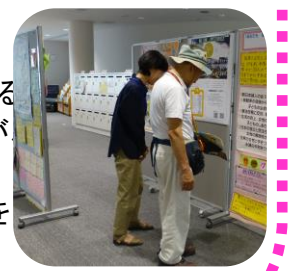
↑参画センターのパネル展

◆パネル展のご意見・ご感想 ●私が知らなかっただけで、たくさんの方が興味を持って参加してくれました。私も興味を持ったものがあるので、私自身や子どものライフステージや状況に応じて、今後は利用や活動してみたいなと思った。 ●工夫が凝らされていて面白かったです。手書きのものの方が注意を引かれました。 ●知らない子育てサークルを知り、興味を持ちました。 ●知っているグループ名が1つもなかったのが驚きとすごいなあと思いました。無償の活動をされるのは、大変な労力だと思いますがこれからの活動をお祈りしたいと思います。多数のご意見ご感想を、ありがとうございました。