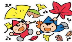
たかまつミライエ地図