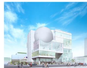
たかまつミライエ 【フロア案内】

お申し込みは、男女共同参画センターまで TEL 087-833-2282・FAX 087-833-2286