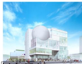
たかまつミライエ