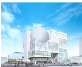
たかまつミライエ