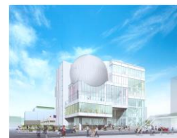
たかまつミライエ