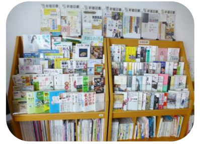
↑参画センターの図書コーナー

参画センターでは、図書コーナーを設けています。男女共同参画関連の本はもちろんのこと、ベストセラー本も少し置いてあります。雑誌も「婦人之友」「明日の友」「かぞくのじかん」「LEE」「天然生活」などの新刊を毎月取り揃えています。お一人3冊まで、2週間借りることができますので、ぜひご利用ください! (図書カードがいっぱいになると、コーヒー券を差し上げています)