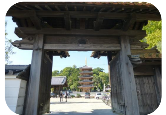
* 法然寺周辺の風景