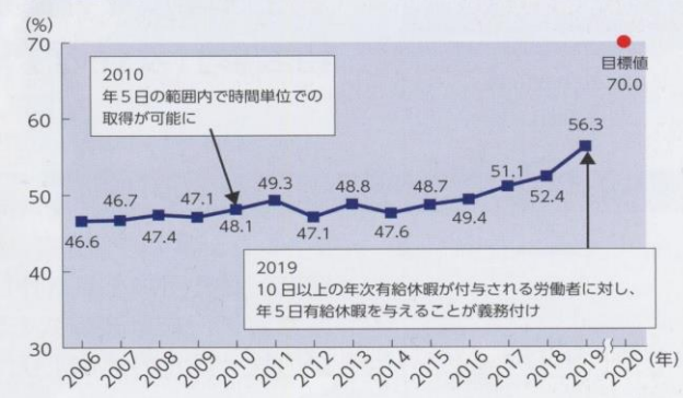
年次有給休暇取得率

これまで関連法の整備として、2019年4月に働き方改革関連法が施行され、使用者に対し、10日以上有給休暇が付与される労働者に対し、年5日時季を指定して有給休暇を与えることが義務付けられました。